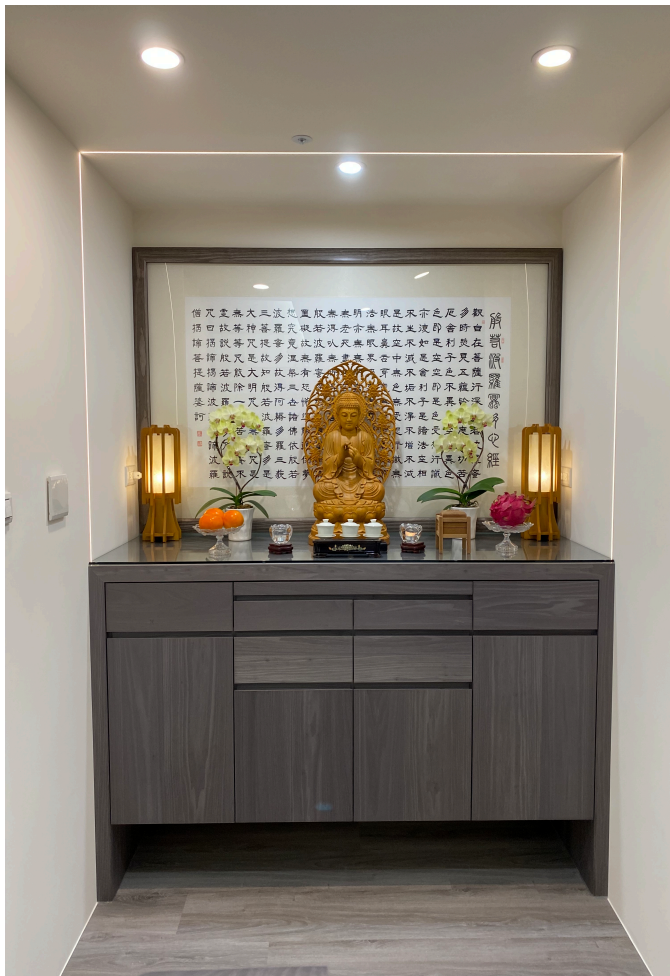
圖例四:佛桌依空間訂製