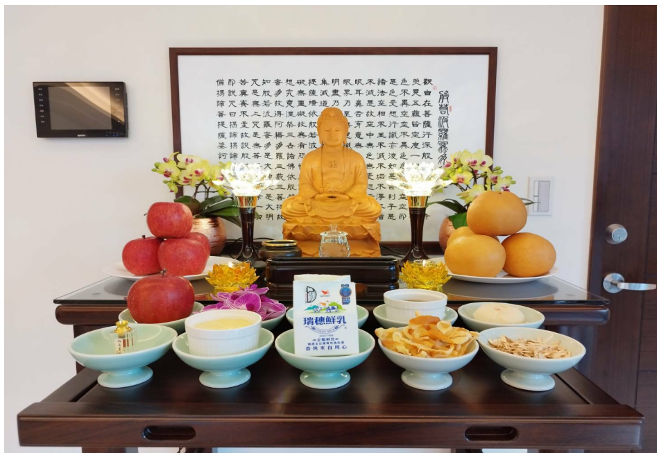
圖例二:背景為心經