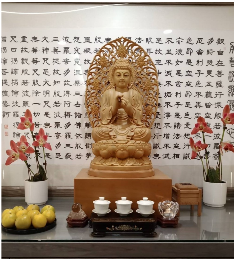
圖例六:聖像加底座(二)