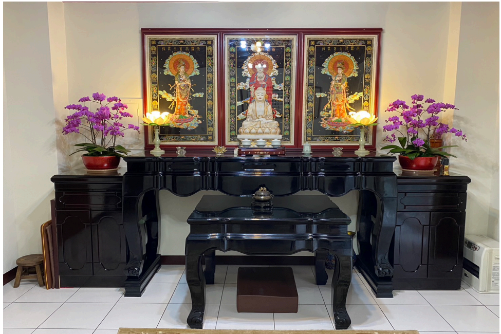
圖例三:背景為菩薩聖像