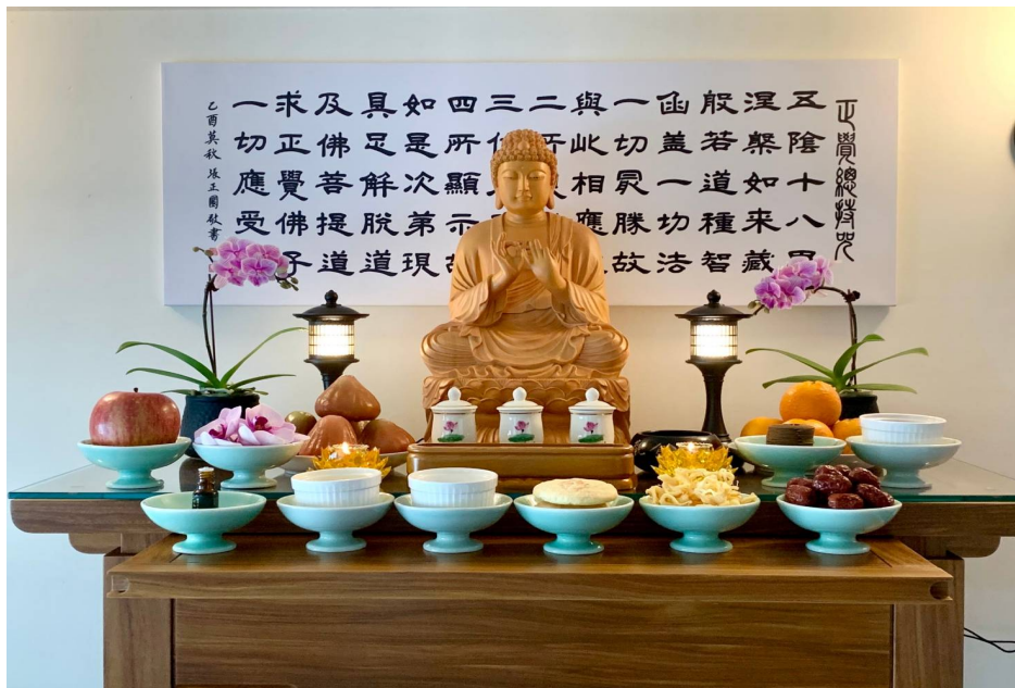
圖例一:背景為總持咒