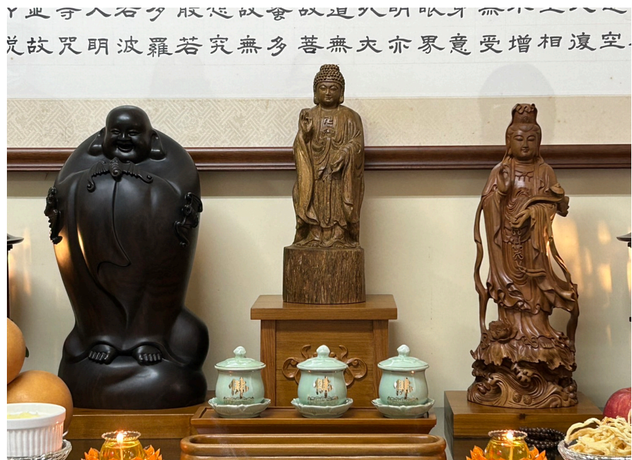
圖例五:聖像加底座(一)